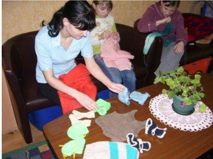
Jaunosios mezgė jos