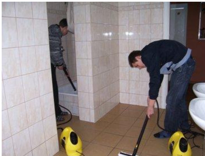
Vaikai mokosi naudotis „Karcher“ garine valymo sistemomis.