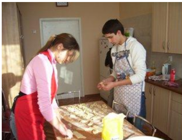
Vaikai gaminasi saldumynus.