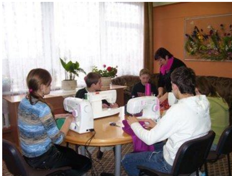
Užsiėmimai vyksta du kartus savaitėje.