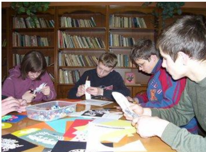
Vaikų karpiniai papuoš globos namus.