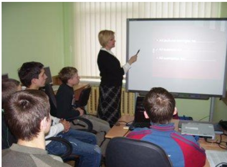
Bendravimo įgūdžių mokymo užsiėmimas.

metu, projekto skirtoje interaktyvioje lentoje, vaikai stebi kino filmus, diskutuoja, kuria įvairias gyvenimiškas situacijas, aptaria jų sprendimo būdus bei perskaitytas knygas.